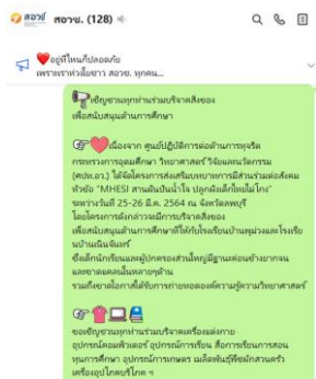
Group Line ของ สอวช.

๒) การรณรงค์ เผยแพร่ข้อมูลข่าวสาร ด้านการป้องกันการทุจริตและส่งเสริมคุณธรรม จริยธรรม